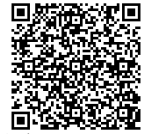
申し込みフォーム QRコード

鹿事研ホームページ ( http://www.kajiken.com ) の申し込みフォームからお申し込みください。なお、右記のQRコードからも申し込みが可能です。 申し込みと大会参加費の振り込みの両方が確認でき次第、申し込み完了となります。